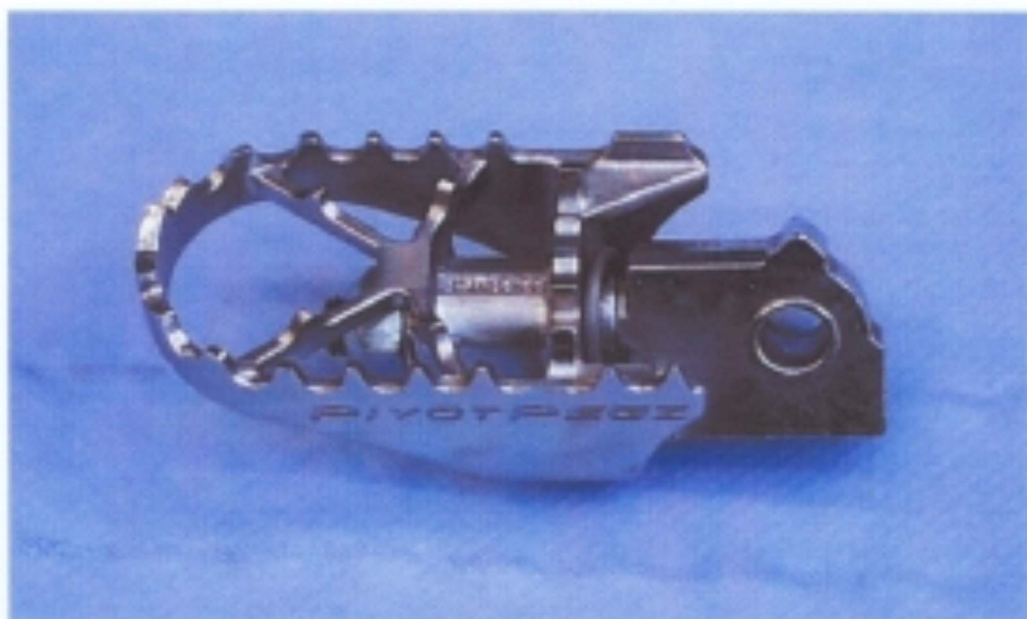
Bild: Prüfmuster Fußraste